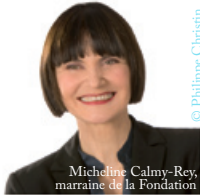
Micheline Calmy-Rey, marraine de la Fondation